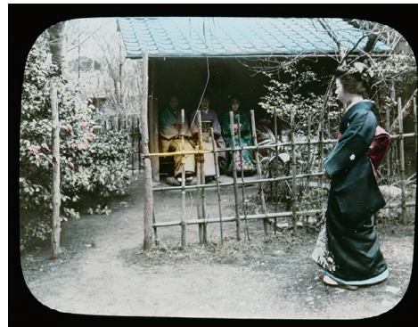
92. "The Ceremonial Tea in Japan" No.1 (「日本のお茶会」No.1)