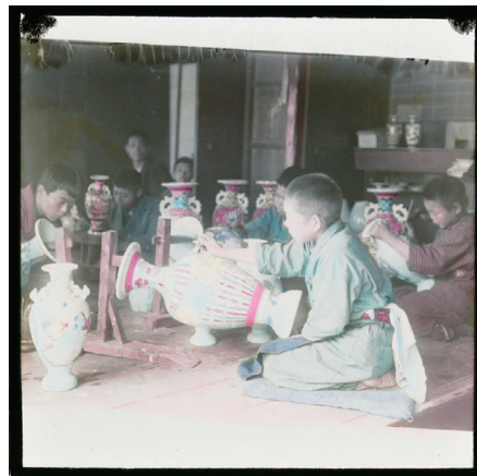
90. (ガラス破損のためタイトル不詳)