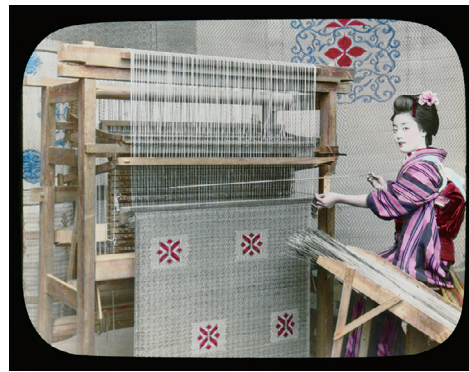
88. Weaving Mats (敷物を織る)