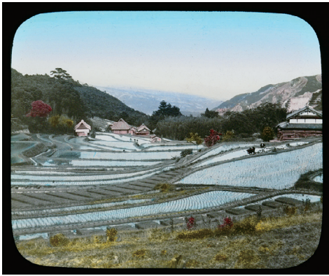
85. A Rice Field (田圃)