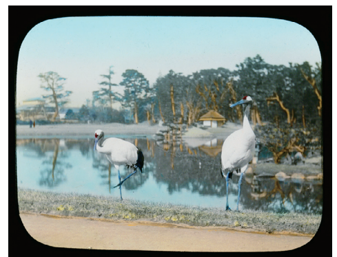
100. Snap-shots of Out-door Life in Japan No.23 (スナップショット 日本の屋外の暮らし No.23)