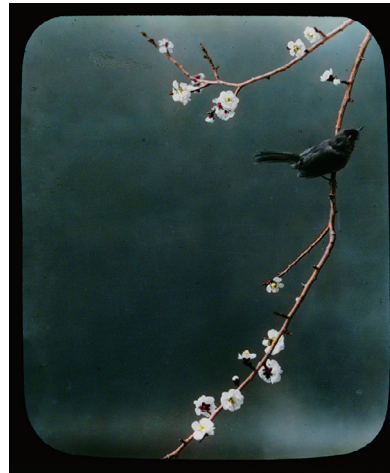
86. Plum Blossom (梅の花)