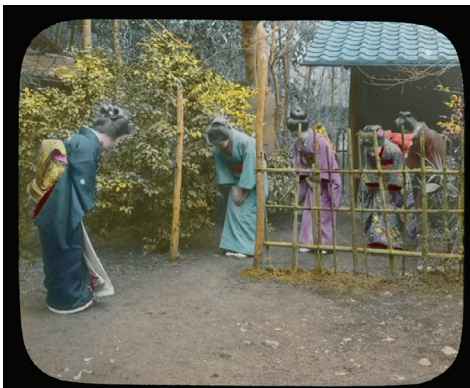
91. "The Ceremonial Tea Observance in Japan" (日本のお茶会)