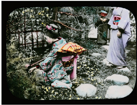
93. "The Ceremonial Tea in Japan" No.3 (「日本のお茶会」No.3)