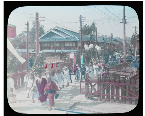
98. Snap-shots of Out-door Life in Japan No.19 (スナップショット 日本の屋外の暮らし No.19)