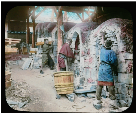
89. "From Nature to Art" No.9 (「自然から芸術へ」No.9)