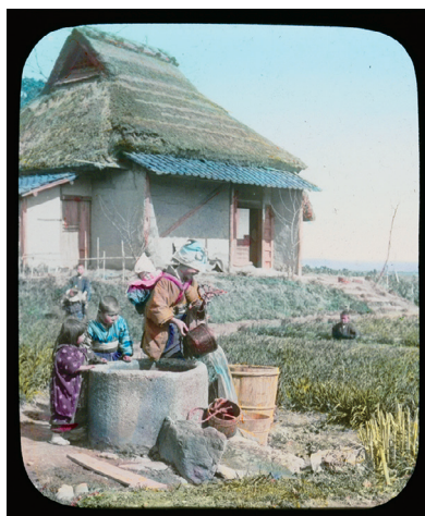
99. Snap-shots of Out-door Life in Japan No.20 (スナップショット 日本の屋外の暮らし No.20)