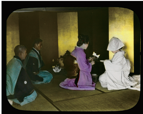
95. "The Ceremonies of a Japanese Marriage" No.11 (「日本の結婚式」No.11)