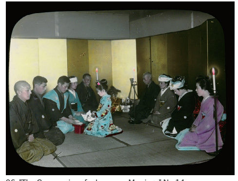
96. "The Ceremonies of a Japanese Marriage" No.14 (「日本の結婚式」No.14)