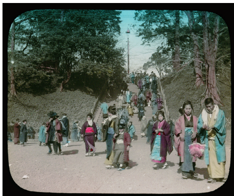
97. Snap-shots of Out-door Life in Japan No.13 (スナップショット 日本の屋外の暮らし No.13)