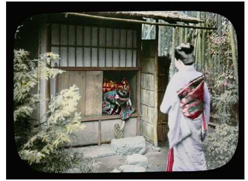
94. "The Ceremonial Tea in Japan" No.4 (「日本のお茶会」No.4)