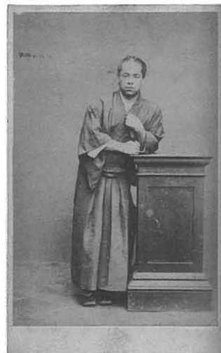
写真2. 後藤象二郎像

以上みてきたように、本作品には上野彦馬による慶応二（1866）年撮影という通説以外にも撮影者、撮影年ともに異なる説がある。先に挙げた昭和十二年の新聞においては、本作品が上野彦馬撮影局において撮影されたことが詳らかでなかったために、その発見に基づいて井上俊三撮影としたが、このことに無理はないだろう。しかし、様々なことがわかってきたことにより、師匠である上野彦馬撮影という通説が生じた。ルーベンスとファン＝ダイクの例を紐解くまでもなく、師匠と門弟の制作者二人がいた場合、どちらかが明確でなければ、その場で制作をしていたのは本来師なのだから、師の作となるのは当然である。それでもなお、門弟の制作であることを明示するのであれば、動かすことのできない明確かつ客観的な証拠が必要となる ※7 。現段