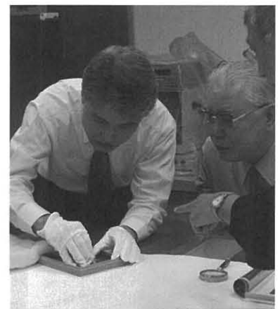
写真3. 桐箱から作品本体の取り出し

ライトボックスに、マイラーシートを引いて保護した上に、作品を置いて観察したところ、画像中央左にある太陽光と思われるハイライト部の濃度は非常に高く、これはアンプロタイプ特有の低濃度とは異