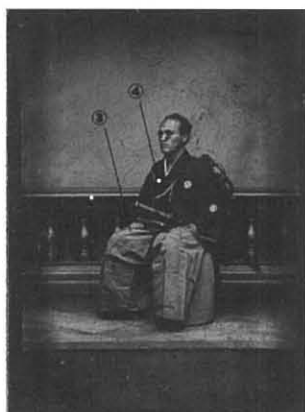
写真7. 田崎道孝像（アンプロタイプ）