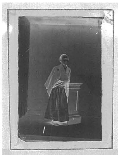
写真5. ライトボックスの上に置かれた坂本龍馬像

以上の結果から、坂本龍馬像の濃度域 \Delta D_T （ D_{TH} - D_{TS} ）は2.33となった。ハイライト部の濃度はアンプロタイプの他の2作品と比較して高い値であったため、コロジオン湿板ネガである可能性が高い。