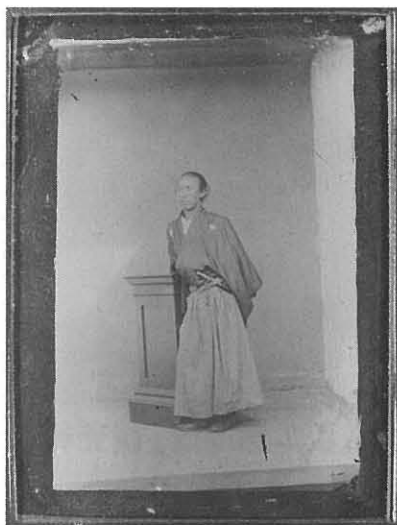
写真1. 坂本龍馬像

当館において平成15年10月12日(日)から11月24日(月・振休)「写真と絵画の展覧会 士 日本のダンディズム」を開催したことに伴い、コロジオン湿板方式による写真・高知県立歴史民俗資料館蔵「坂本龍馬像」の借用をうけた。本稿はこれに基づく調査報告である。