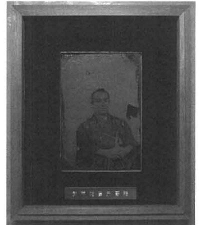
写真11. 後藤象二郎像 （高知県立歴史民俗資料館蔵）