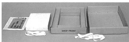
写真10. 作品を収納する保存箱一式