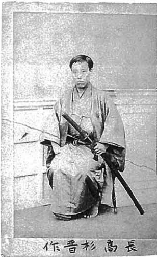
写真12. 高杉晋作像 (港区立港郷土資料館蔵)