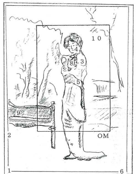
写真1のつづき:色度測定部位の略図(オーバーマートを外した印画の略図) OM:オーバーマートの開口縁辺を示す線 1~10:色度測定部位(色度図中の番号と対応する)