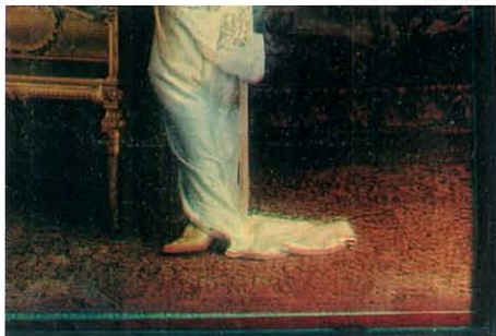
写真3: Polychromide Printのオーバーマートを外した部分(プリントの左下部) 重ね合わせ不十分で原色が露呈してる

さらに、カラープリントのマゼンタ画像は次の手法により作製されたものと推測される。まず、緑色分解ネガ画像から銀塩感光材料で分解ポジ画像を作製し、このポジ像を銀塩ゼラチン紙に焼き付け・現像して濃度分布に従ってゼラチン層を硬化させる。次に、ゼラチンの非硬化部分にアリザリン染料を吸着させ、上述の調色済みの印画紙に密着して染料を転写したものであろう。