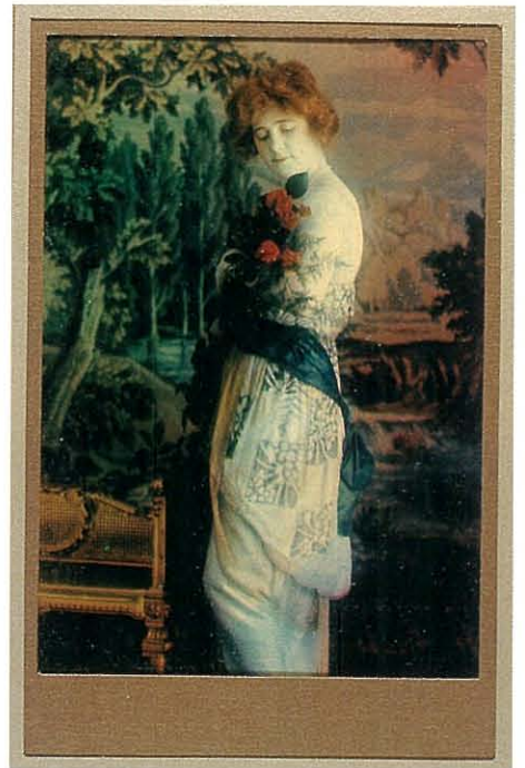
写真1:今世紀初期に制作された古典カラープリント (Polychromide Print)

この種の調色方法によるカラープリントは、当時多くの試みがなされたが、実用されたものはHamburgerのPolychromide、ShepherdによるToriadochrome、Defender Photo Supply Inc.によるChromatoneなどである 4) 。