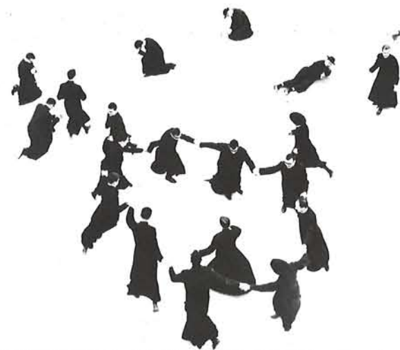
「私には自分の顔を愛撫する手がない(通称:若き司祭たち)」より 1961-1963年

詳細ホームページ： http://www.syabi.com./schedule/schedule.html