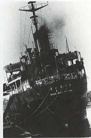
北海道 留萌 1978年