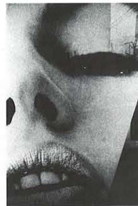
青山(「エロスあるいはエロスではないにか」) 1968年 東京都写真美術館蔵

※詳細ホームページ: http://www.syabi.com./schedule/schedule.html