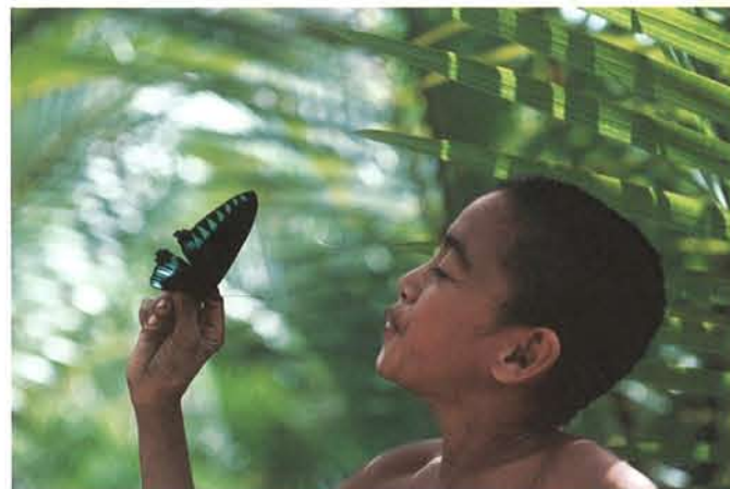
オオアカエリトリバネアゲハと少年 フィリピン 1982年

本展では、彼の代表作「世界昆虫記」「昆虫記」から、新作を含む昆虫の生態を中心に約200作品を展示。昆虫に向かう彼のまなざしは、昆虫たちの背後にある自然、さらには人間の営みにまで踏み込み、自然と人間の関連性をも浮かび上がらせます。