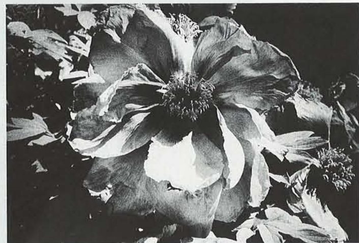
光と影 1981年

東京都写真美術館に収蔵されている作品のうち、その大半は90年の開館時に収集されたものです。作品の選定は自分自身で行いました。スランプ時代の〈北海道〉の割合が多いのでは、ということですが、特に理由はありません。美術館に収めたい作品を自分なりに選んでいった結果、〈北海道〉が多くなったのかもしれませんが、「レトロスペクティヴ 1965-2005」ではこれまで比較的多く紹介されてきた60