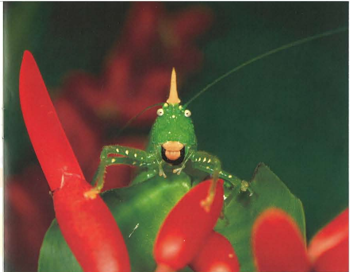
キイロツノギス コスタリカ 1992年

小さな命でありながら、人間には想像もできない優れた機能と、優雅さ、美しさを兼ね備えた昆虫たち。彼らの生き方は千差万別で、奇抜な形態も、あでやかな色彩も、そして不思議な行動もそれぞれの種類にだけ備わった固有性をもっています。今森のファインダーの中で繰り広げられる生命の神秘と自然の驚異に満ちた昆虫の世界は、芸術と科学が高い次元で統一され、私たちに大きな感動を与えてくれることでしょう。