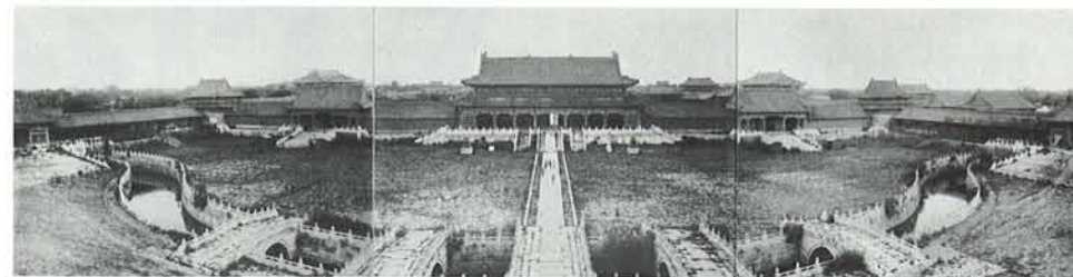
「清国北京皇城写真帖」東京帝室博物館編纂 撮影:小川一真、発行所:小川一真出版部、1906年刊より 太和門、撮影:1901年 コロタイプ印刷

詳細ホームページ： http://www.syabi.com./schedule/schedule.html