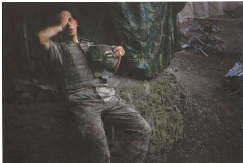
【大賞】ティム・ヘザリントン 9月16日、アフガニスタンのコレンガル渓谷の掩蔽壕で休息をとる米軍兵士