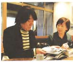
展覧会担当の同僚友子学芸員と談笑する森山大道氏

森山 大道 (もりやま だいで) 商業デザイナーを経て、1963年にフリーの写真家となる。67年『にっぽん劇場』で日本写真批評家協会新人賞受賞。99年サンフランシスコ近代美術館、2003年カルティエ現代美術財団で開催するなど海外でも幅広く活躍している。04年ドイツ写真協会 文化功労賞受賞。