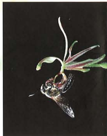
ドラゴンヘッドオーキッド オーストラリア 1991年