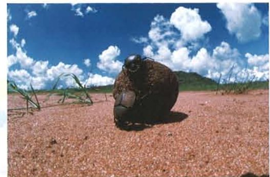
アフリカタマオシコガネ ケニア 1983年

小さな命でありながら、人間には想像もできない優れた機能と、優雅さ、美しさを兼ね備えた昆虫たち。彼らの生き方は千差万別で、奇抜な形態も、あでやかな色彩も、そして不思議な行動もそれぞれの種類にだけ備わった固有性をもっています。今森のファインダーの中で繰り広げられる生命の神秘と自然の驚異に満ちた昆虫の世界は、芸術と科学が高い次元で統一され、私たちに大きな感動を与えてくれることでしょう。