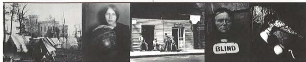
【図左から】アレキサンダー・ガードナー マレー地、バングラデシュの難民キャンプ 1863年「南北戦争写真帖 第一巻」より、ジョージ・ヘンリー・シラー 地球儀にもたれる少女 1910年 ウォーカー・エヴァンズ 床屋、黒部の町 1936年/ボリス・ストランド ブラインド・ウーマン 1916年/ジョエル・ポーター・ワトキン 顔に顔を作る女、ニューメキシコ 1979年