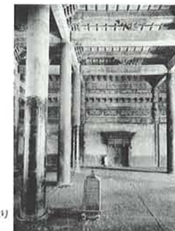
「清国北京皇城写真帖」東京帝室博物館編纂 撮影:小川一真、発行所:小川一真出版部、1906年刊より 太和殿内部、撮影:1901年 コロタイプ印刷