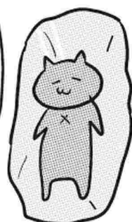
コールドスリープ