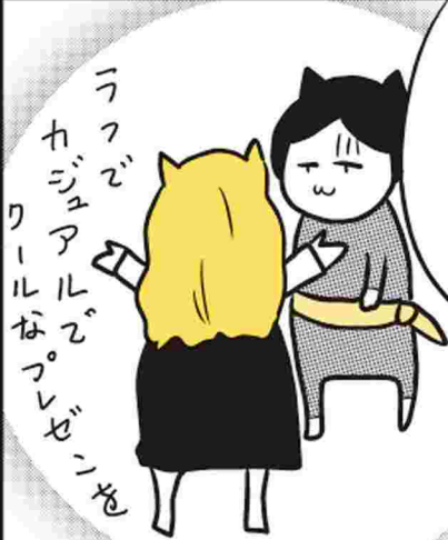
ラフで カジュアルなプレゼン