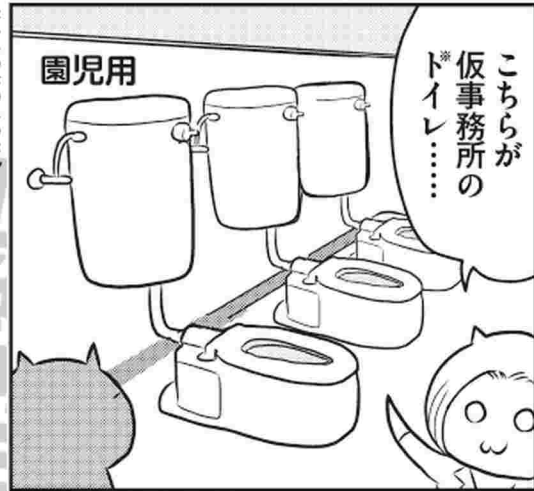
園児用 ※一部を大人用に改修しています。