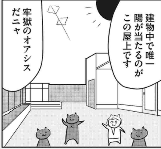
※ある日、ミツイ学芸員がカサハラ課長に締め出されました。